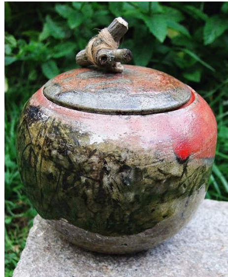
Keramické ležení na jarmarku