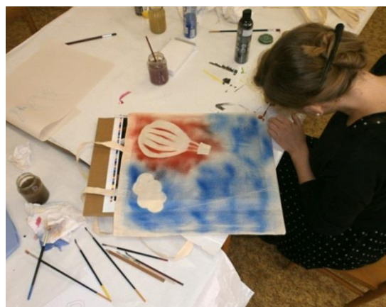
Stavěli jsme a pouštěli modely horkovzdušných balonů