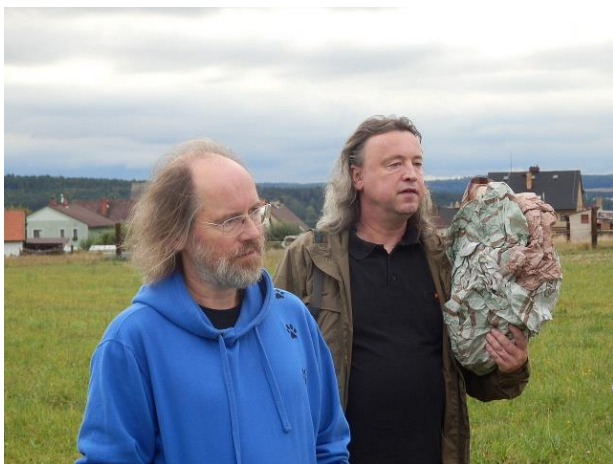
Došlo i k památnému setkání Prahy s Brnem